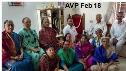
AVP Feb 18