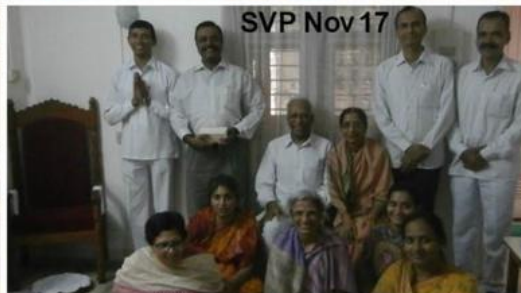
SVP Nov 17

Vsak novi priučeni AVP dobi osebnega mentorja, ki ga vodi v služenju do predvidenega napredovanja za polnega zdravilca VP. V času zadnjih štirih delavnic, ki so jih vodili ti učitelji v letih 2017-18, so usposobili 16 ljudi iz Indije in 5 iz Avstralije. SVP delavnice potekajo v Indiji samo v Puttapparthiju enkrat letno. Novembra 2017 je postalo