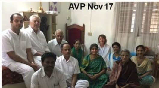
AVP Nov 17