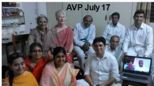
AVP July 17